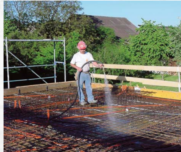
Schalung und Armierung vorwässern