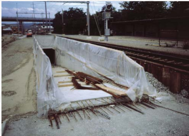
vor Kälte schützen